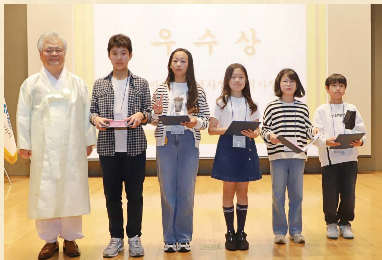
▲훈민정음 독후감 공모 시상식

56대 사회부총리 겸 교육부장관을 역임한 황우여 훈민정음탑건립조직위원회 대표조직위원장은 “우리 대한민국은 훈민정음을 보유한 문자 선진국일 뿐만 아니라, 세계적인 문자학자들이 찬탄하는 훈민정음을 사용하는 자랑스러운 문자 강국입니다.”라며 “그러함에도 아직까지 대한민국에 훈민적음의 애족·애민 창제 정신을 기리는 기념탑이 없다는 사실은 굉장히 놀랍기도 하지만 한편으로는 대단히 부끄러운 일이기도 합니다.”라며 탑 건립의 당위성에 대해 이야기했다. 이어 “훈민정음의 창제 정신을 상징할 수 있는 훈민정음탑을 이후 전국의 초·중·고등학교 교정에도 건립하여 자라나는 2세들에게 훈민정음에 대한 올바른 이해와 자긍심을 심어줄 수 있도록 뜻있는 국민 여러분의 뜨거운 관심과 많은 참여를 기대합니다